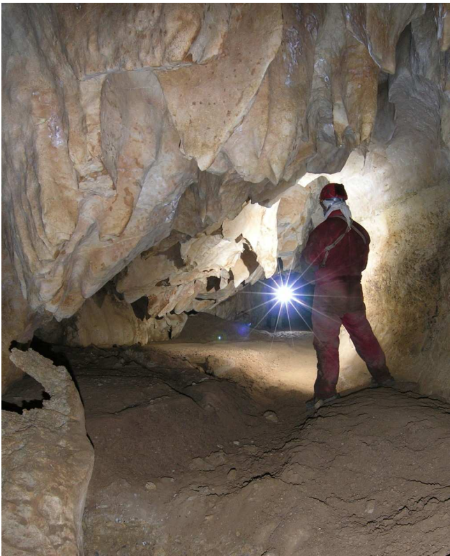
Wadi at the Illegalen Harem, area of Appelhaus, Totes Gebirge

* dated 08.12.2011, offer of excursions with reservation, changes are possible, more detailed information to all the excursions will be given soon.